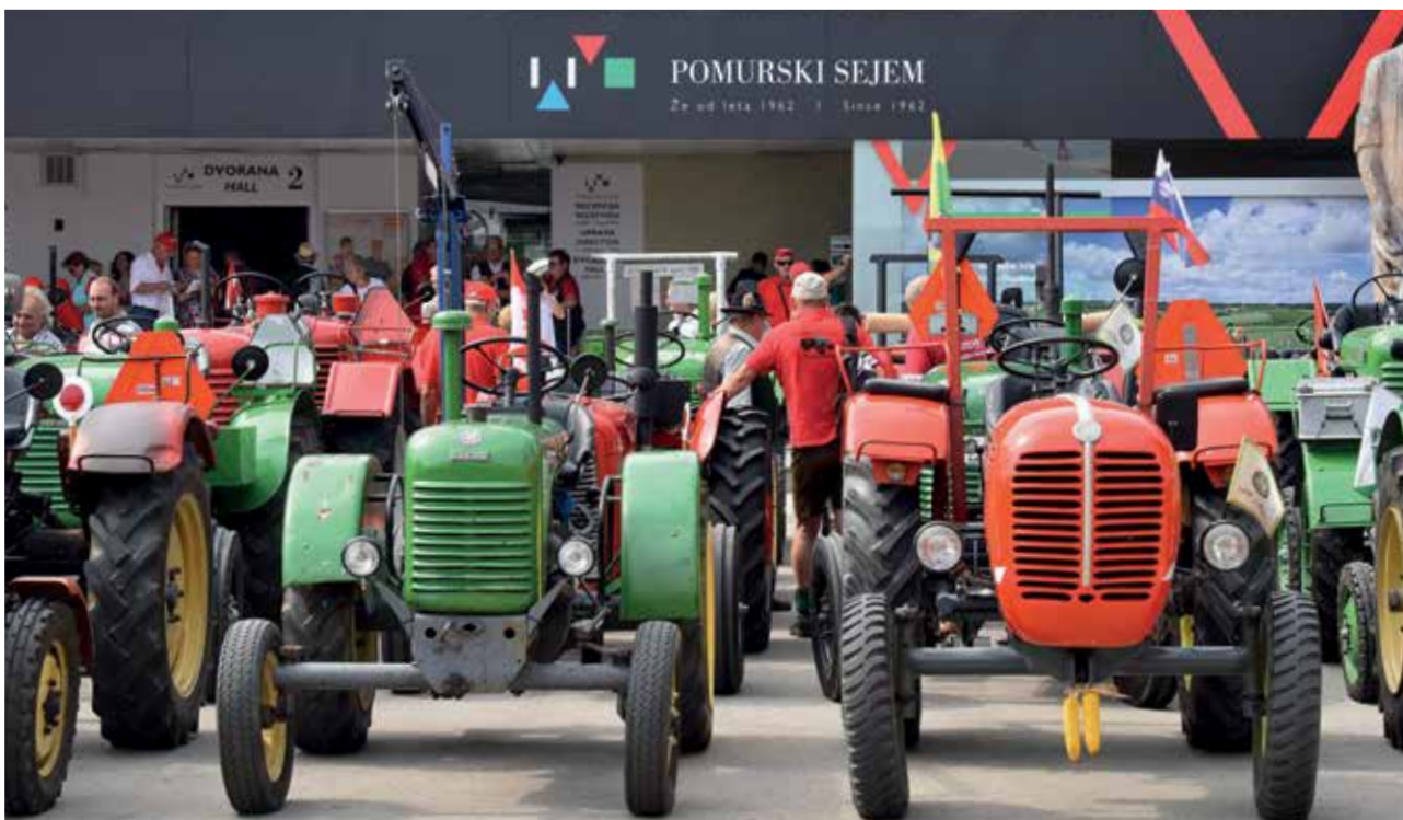
Srečanje starodobnih traktorjev Steyr