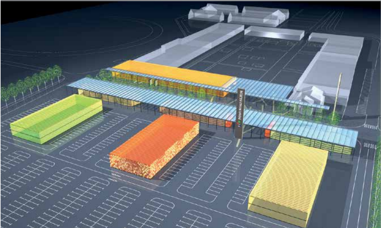
Prostorska vizija razvoja Pomurskega sejma

Sejemska dejavnost, za katero uporabljamo v Evropi tudi naziv sejemska industrija, je dejavnost, za katero bi v obstoječih sistemih izobraževanja težko opredelil način in smer izobraževanja. Prav pridejo vsa znanja, ki jih pridobimo na katerikoli šoli. V bistvu pa je to dejavnost, pri kateri je na eni strani glavni cilj zadovoljiti razstavljalce in na drugi strani obiskovalce sejma. Prvi morajo s sejmom doseči