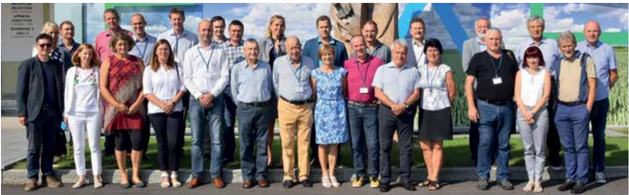
Komisija odprtega državnega ocenjevanja Vino Slovenija Gornja Radgona v letu 2018