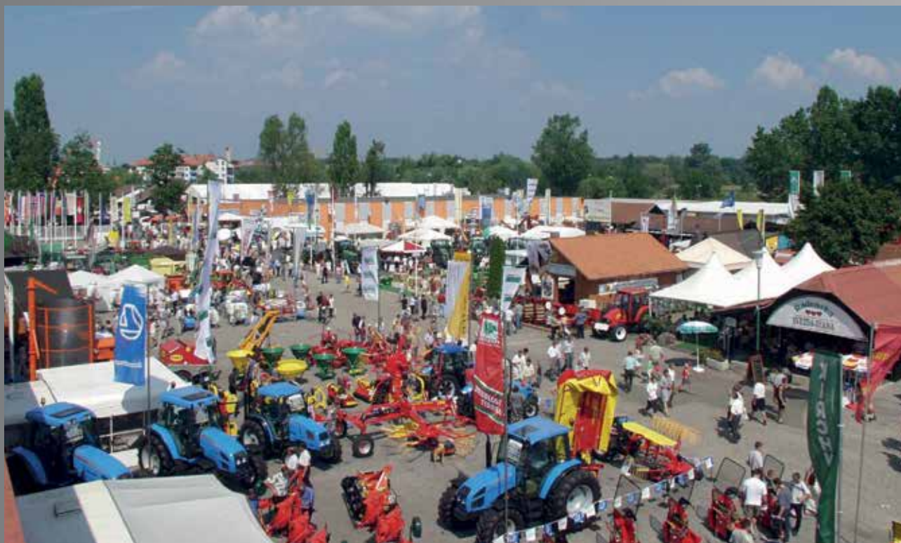
Mednarodni kmetijsko-živilski sejem, 2001

Desetletje vztrajnosti in hoje po robu je na pragu leta 2000 končno pripeljalo Pomurski sejem do popolne samostojnosti. V tem času je bilo pomembno predvsem to, da kljub negotovosti obdržimo sejemske projekte in ocenjevanja ter sodelavce in prijatelje.