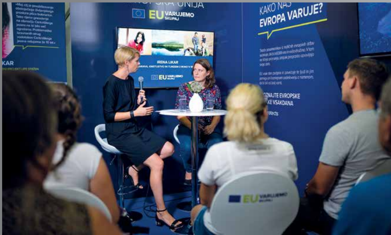
Mednarodni kmetijsko-živilski sejem AGRA, 2019

V zadnjih dveh letih je sejemska dejavnost ne samo v Gornji Radgoni in Sloveniji, ampak na celotnem planetu pred največjimi izzivi v celotni zgodovini sejmarstva. Epidemija novega koronavirusa je skoraj zaustavila celotno industrijo srečanj. Ali se bo ta industrija znala pobrati, bo odvisno od nadaljnjega razvoja globalnega gospodarstva, digitalizacije in ukrepov, povezanih z zdravjem. Pomurski sejem bo vsekakor tudi v prihodnje gradil na tradicionalnih in novih projektih.