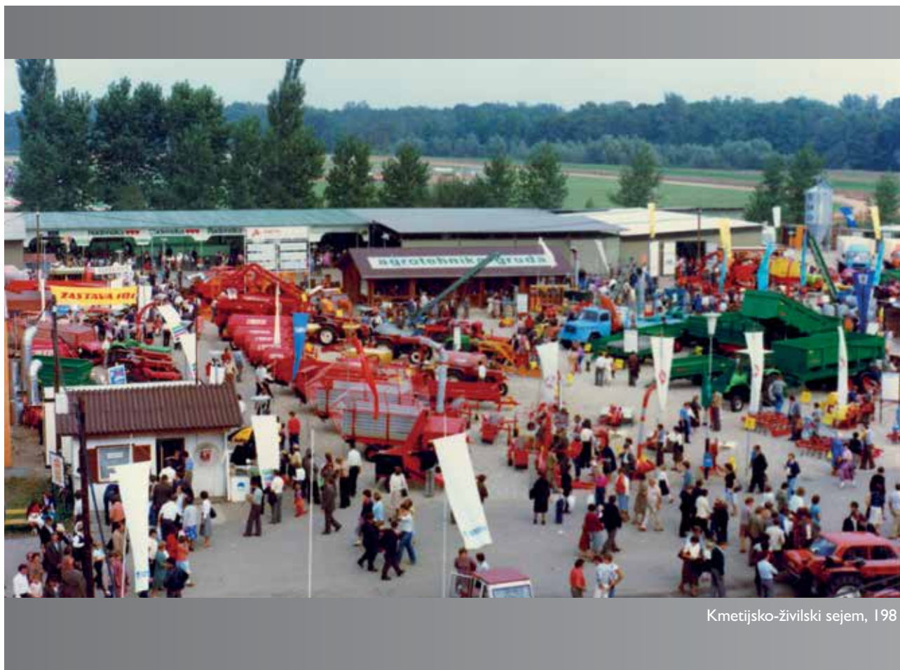
Kmetijsko-živilski sejem, 1981

S prevzemom Pomurskega sejma je Gospodarsko razstavišče Ljubljana oblikovalo poslovno enoto Pomurski sejem. Ta je v svoje načrte poleg Kmetijsko-živilskega sejma vključila tudi organizacijo jugoslovanskega sejma gradbeništva z mednarodno udeležbo. Za ta projekt pa je bilo nujno zaposliti nekoga, ki obvlada področje gradbeništva in še posebej tehnike.