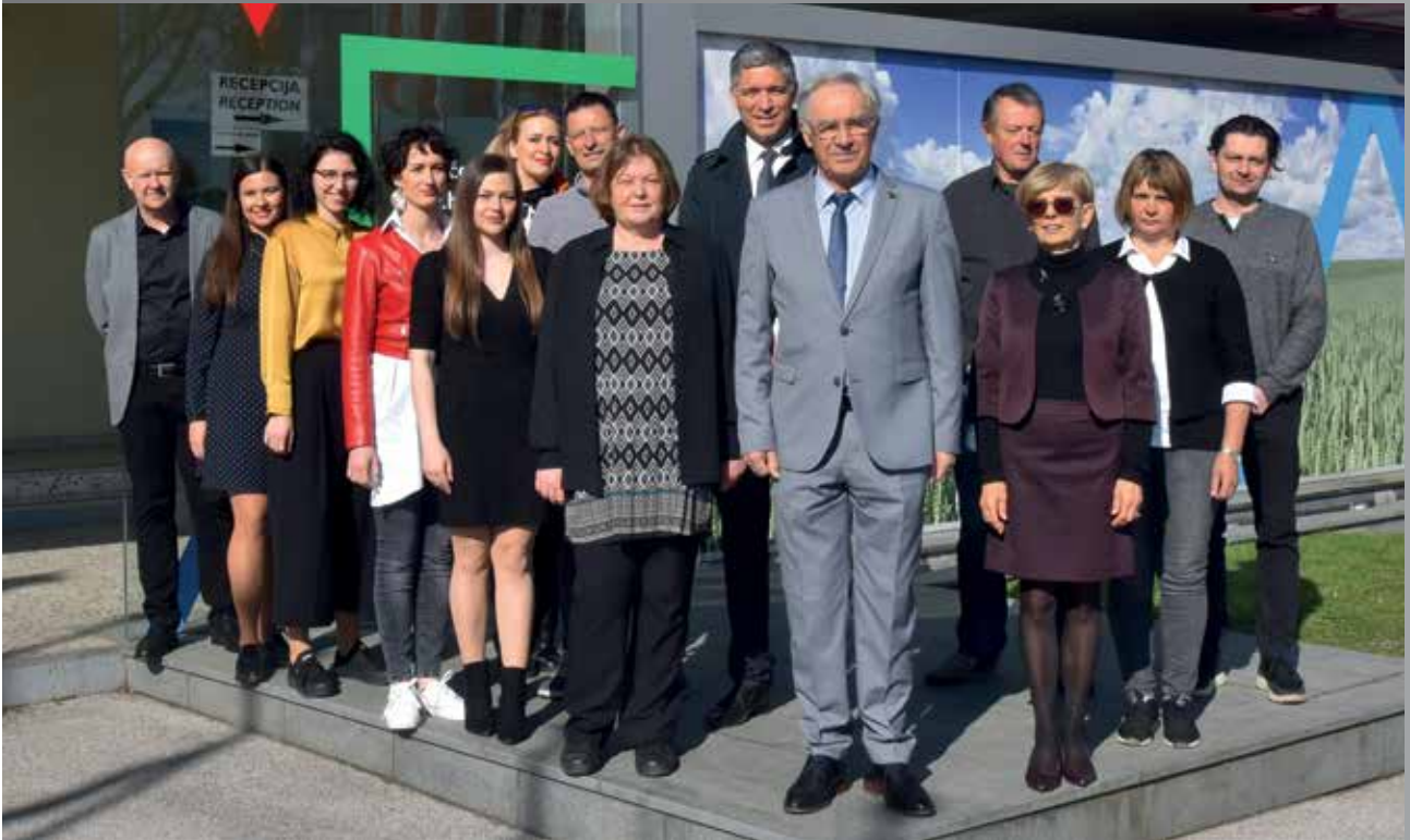
Ekipa Pomurskega sejma v letu 2022

Gornja Radgona je dihala s sejmom vse do trenutka, ko je v nekem smislu prerastel okvirje, ki so bili z ozirom na prometno infrastrukturo in razvoj mesta še obvladljivi. Danes je pristno sodelovanje z okoljem še vedno prisotno, vendar pa v profesionalnem in tržnem principu ni več veliko prostora za entuziazem. Potreben je profesionalen pristop, saj je Pomurski sejem tudi del evropske in svetovne sejemske scene. Članstvo v svetovnem združenju UFI in evropskem združenju EURASCO zavezuje Pomurski