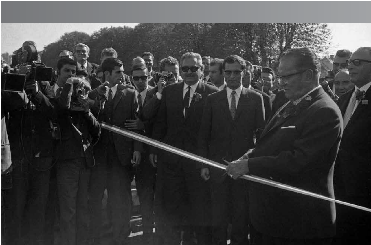
Odprtje Mostu prijateljstva, 1969

Občinski veljaki in zanesenjaki so se naenkrat zavedli pomena obmejnega sodelovanja, ki je dobilo nove dimenzije prav preko sejmov. Tudi vodilni predstavniki občine Radkersburg in Okraja Bad Radkersburg so skupaj z lokalnimi trgovci in podjetniki začutili priložnost za gospodarsko in prijateljsko sodelovanje.