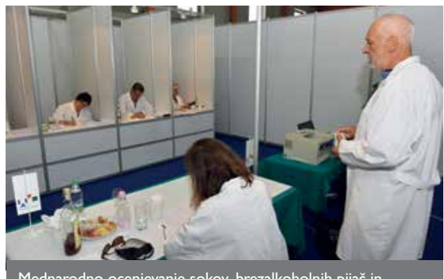
Mednarodno ocenjevanje sokov, brezalkoholnih pijač in embaliranih vod