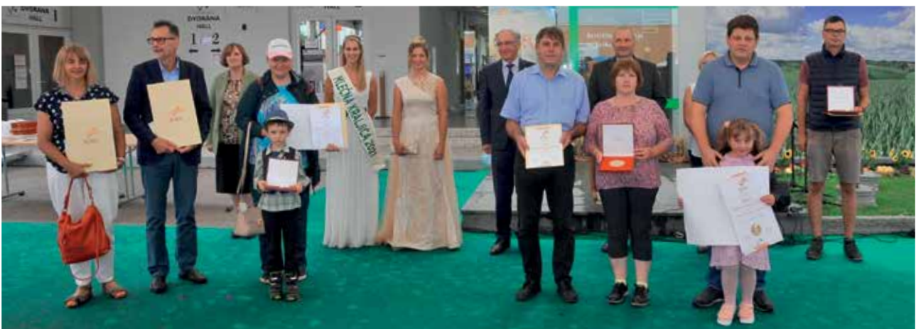
Najvišja priznanja Mednarodnega ocenjevanja mleka in mlečnih izdelkov, 2021