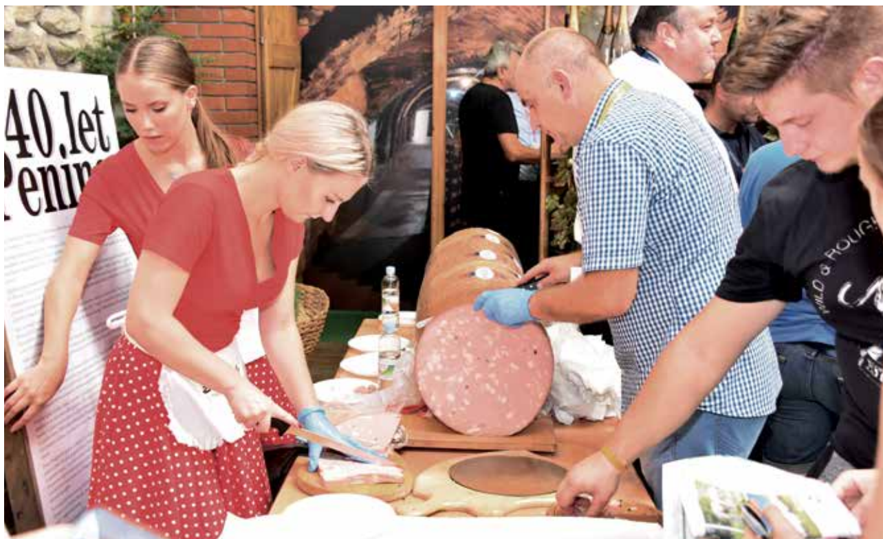
Predstavitev prehranskih izdelkov