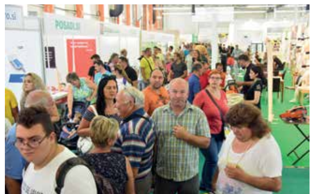
Vedno znova zadovoljni obiskovalci