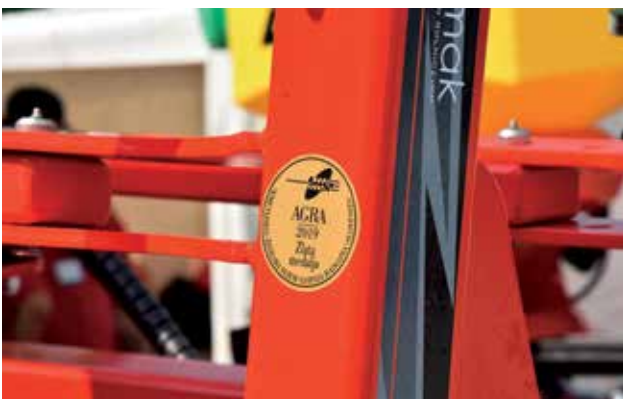
Mednarodno ocenjevanje kmetijske mehanizacije in opreme