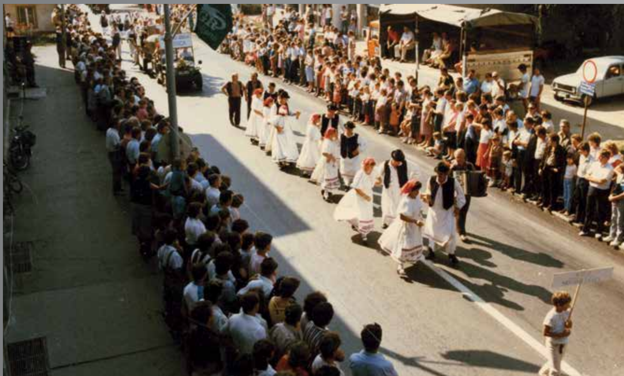
Parada kmečkih običajev, 1988

Osemdeseta leta so Pomurskemu sejmu postregla z vsem, kar je sicer v tem obdobju spremljalo politiko in gospodarstvo. Kot poslovna enota Gospodarskega razstavišča pa smo se lahko neobremenjeno ukvarjali z organizacijo sejmov in drugih projektov brez vmešavanja lokalne politike. Po drugi strani so bili Ljubljanci veseli, da smo bili uspešni in smo prinašali v skupno blagajno dovolj prihodka.