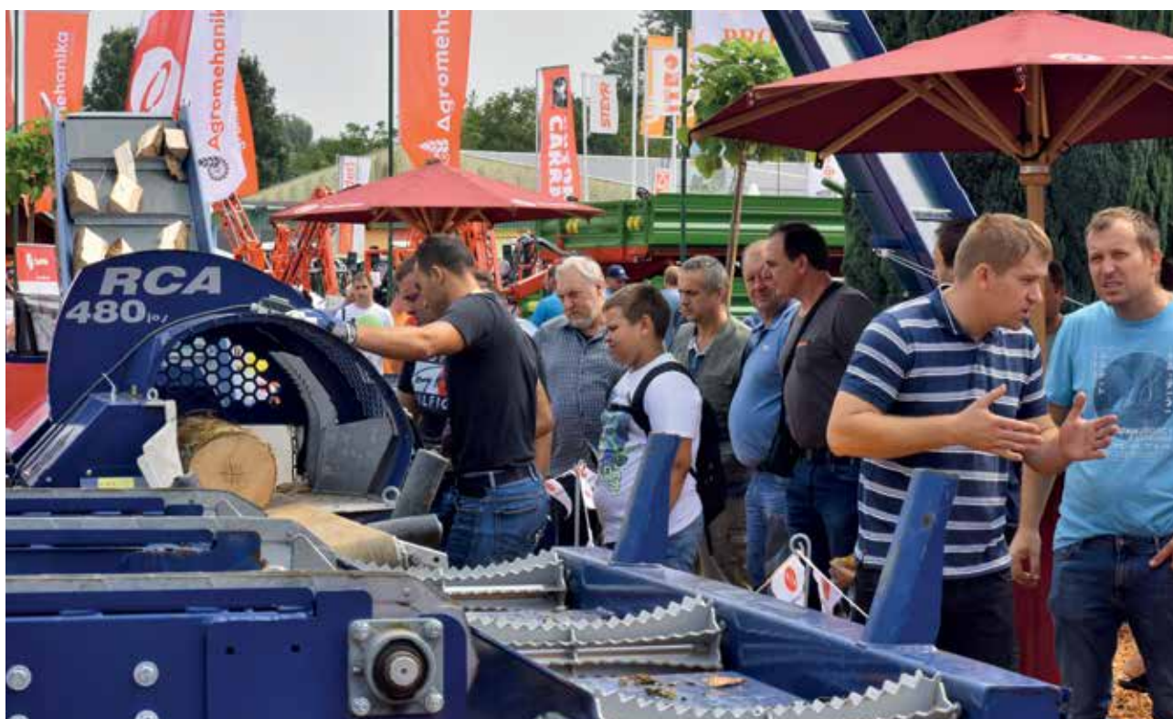
Oprema za gozdarstvo