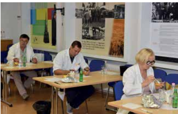
Ocenjevanje medu z mednarodno udeležbo