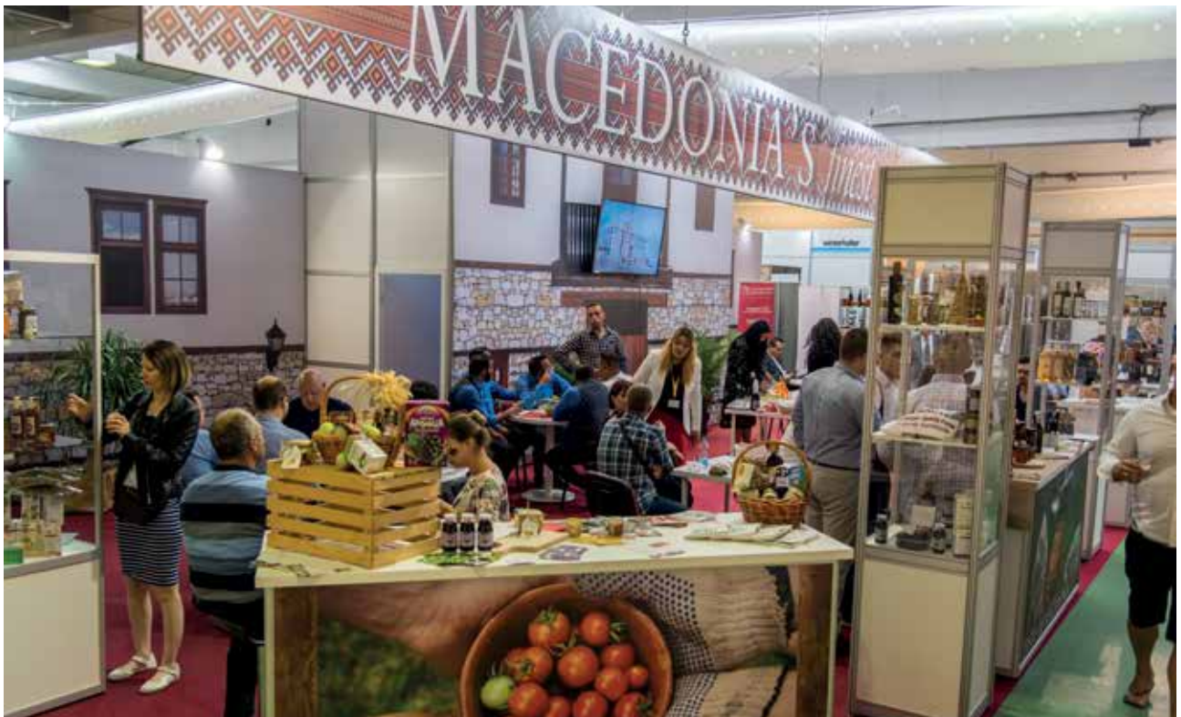
Predstavitve tujih držav in regij