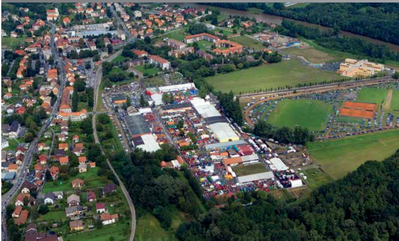
Pomurski sejem v Gornji Radgoni

Pomurje je znano po neizmerno bogati naravni in kulturni dediščini, ki daje pridih avtohtonosti še tako globalnim dogodkom. Ker je v Gornji Radgoni doma tudi najstarejša slovenska klet penečih se vin, se upravičeno ponaša z nazivom »mesta sejmov in peninek«.