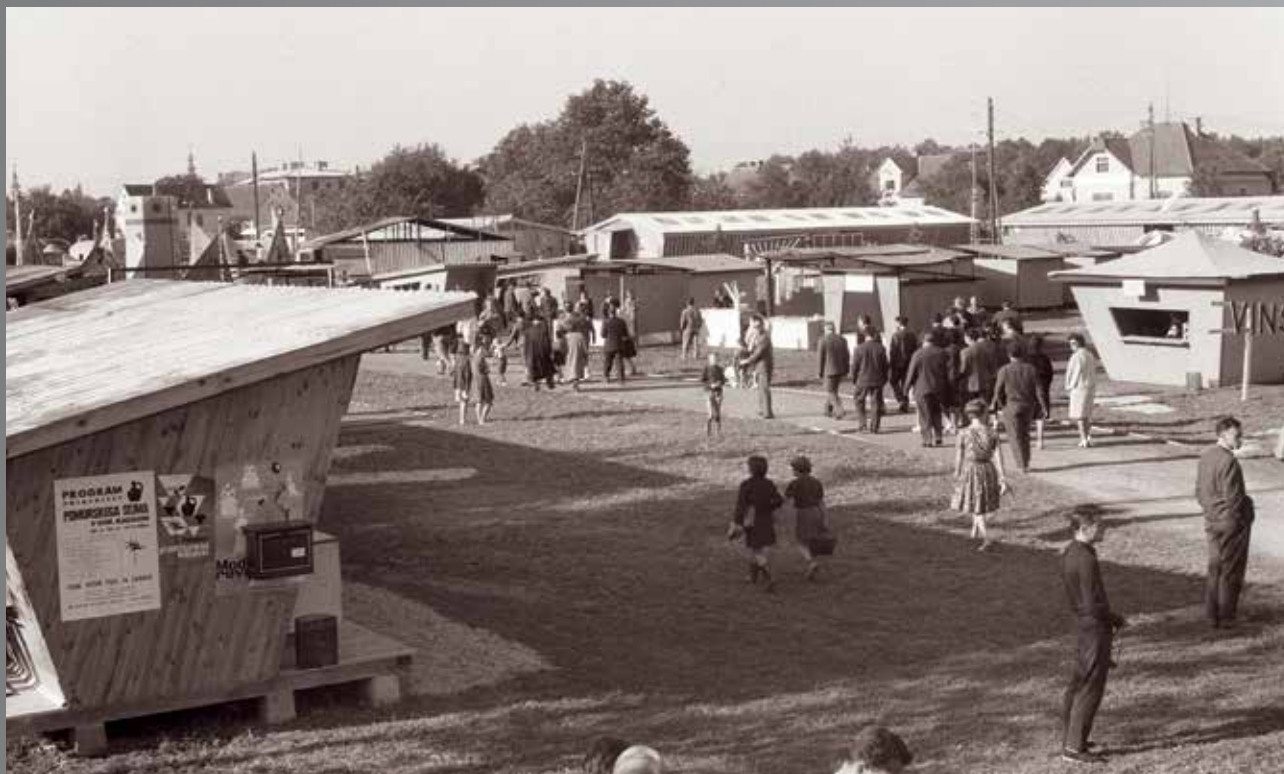
Prvi Pomurski sejem v Gornji Radgoni leta 1962

Sejemska dejavnost v Gornji Radgoni pa ima globoke korenine. Radgona je imela kot posest deželnega vojvode že v srednjem veku velike tržne privilegije in kmalu postala sejemski kraj z živahno gospodarsko dejavnostjo. Iz srednjeveških semnjeve so se v 19. stoletju razvili sejmi v pravem pomenu besede. Septembra 1877 je bila v Radgoni velika razstava kmetijskih pridelkov, živine in vinogradništva. Od leta 1878 je tu vsak prvi četrtek v mesecu potekal živinski sejem.