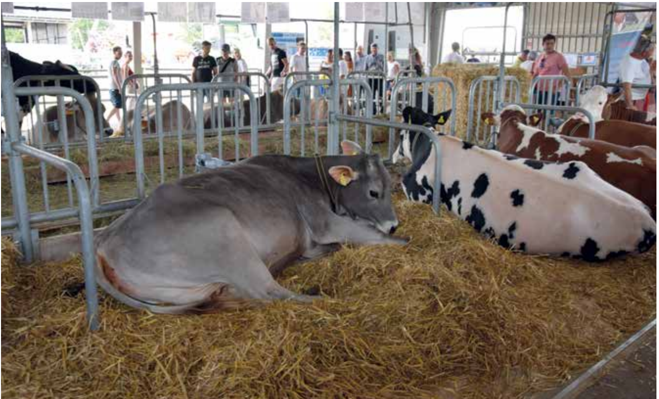
Strokovne razstave živali