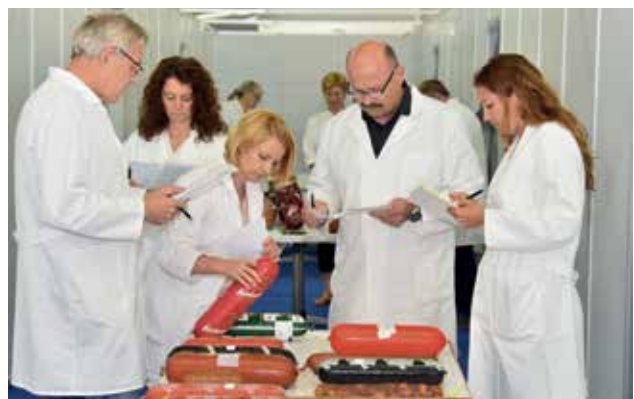
Mednarodno ocenjevanje mesa in mesnih izdelkov