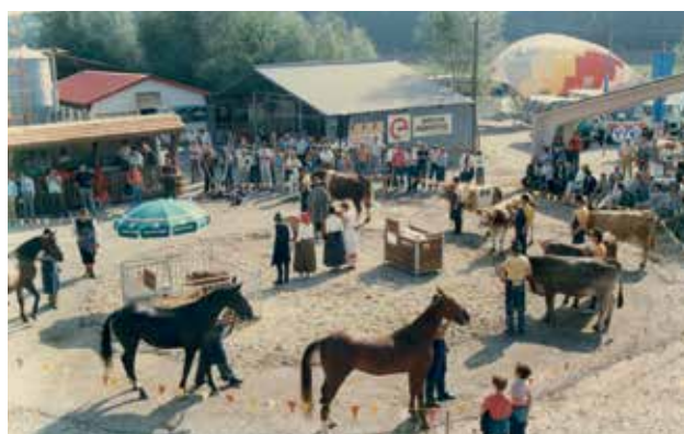
Predstavitve živali na maneži, 1986

Osemdeseta leta so Pomurskemu sejmu postregla z vsem, kar je sicer v tem obdobju spremljalo politiko in gospodarstvo. Kot poslovna enota Gospodarskega razstavišča pa smo se lahko neobremenjeno ukvarjali z organizacijo sejmov in drugih projektov brez vmešavanja lokalne politike. Po drugi strani so bili Ljubljanci veseli, da smo bili uspešni in smo prinašali v skupno blagajno dovolj prihodka.